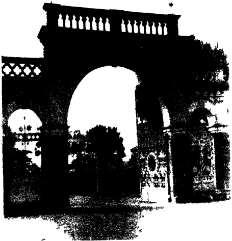
आखिरकार दरवाजा खले